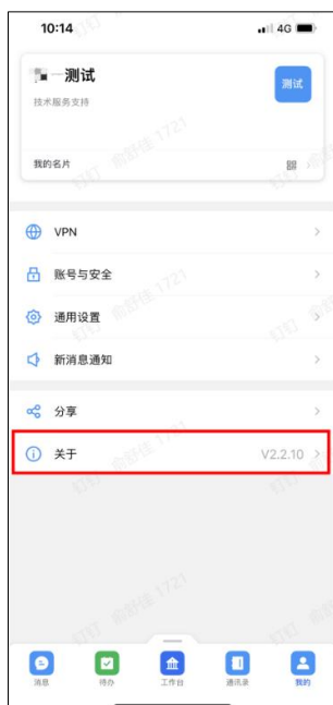
图 查询当前使用版本界面

操作步骤：郑政钉 APP-【我的】-【关于】-显示当前使用的版本信息、发版日期、版本更新说明。